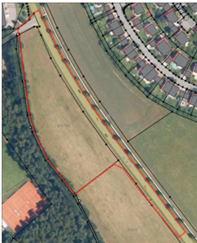
Lageplan Geltungsbereich; verkleinerte Darstellung ohne Maßstab; Bearbeitung Markt Lappersdorf

Der Geltungsbereich umfasst das Grundstück mit den Flurnummern 519/2 (Teilfläche) 519/34, 520 (Teilfläche) (Straße zum „Harreshof“) und 244 (Kreisstraße R 15), jeweils der Gemarkung Hainsacker und ist aus den nachfolgenden Übersichtskarten ersichtlich.