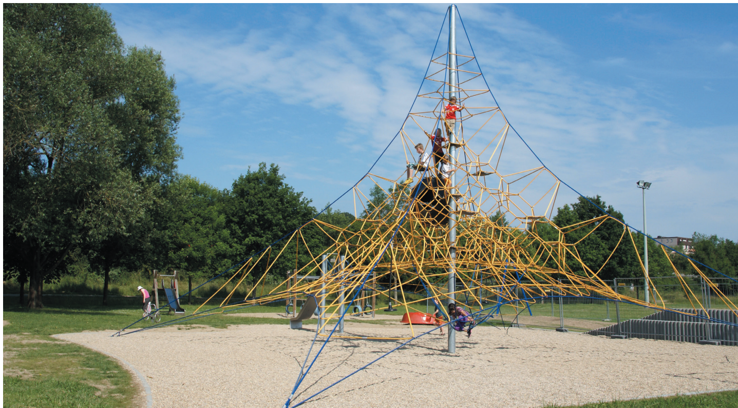
Spielplatz Am Regen