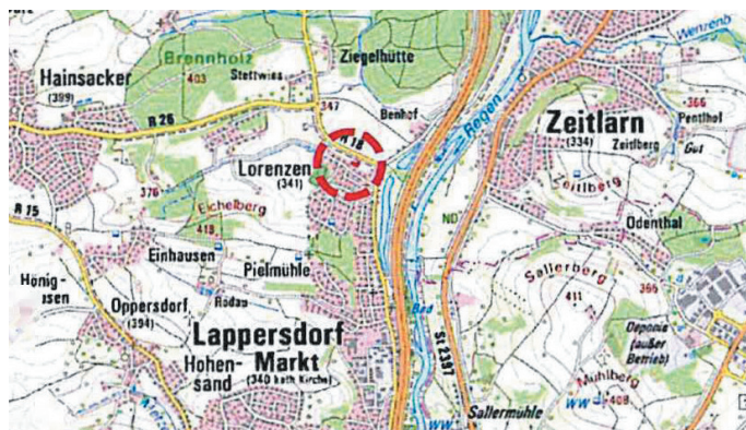
Lageplan Änderungsbereich, o.M.

Der Änderungsbereich ist aus den nachfolgenden Übersichtskarten ersichtlich.