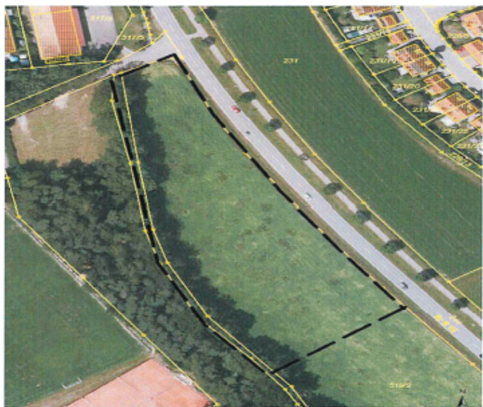
Lageplan Geltungsbereich; verkleinerte Darstellung ohne Maßstab; Bearbeitung Markt Lappersdorf

Der Geltungsbereich umfasst das Grundstück mit der Flurnummer 519/2 (Teilfläche) der Gemarkung Hainsacker und ist aus den nachfolgenden Übersichtskarten ersichtlich.