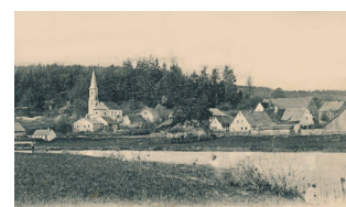
Kirchdorf Lorenzen am Regen, 1903

Für das Jahr 2023 hat der Markt Lappersdorf einen Fotokalender mit dem Titel „Lappersdorf in alten Ansichten“ erstellt. Die Bilder stammen aus dem Marktarchiv und wurden von unseren Bürgerinnen und Bürgern zur Verfügung gestellt. Der Kalender gibt einen interessanten Einblick in die Geschichte unserer