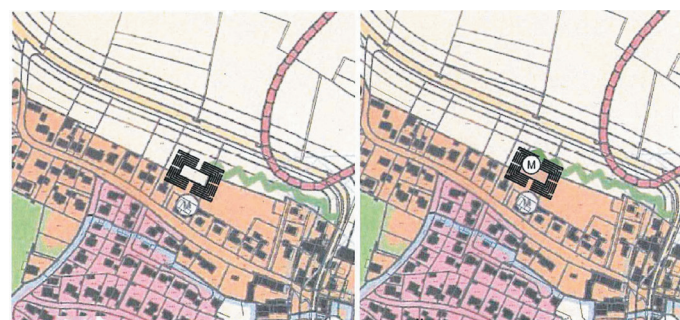
Auszug Flächennutzungs- u. Landschaftsplan, o.M.